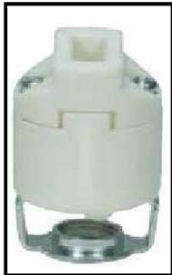
Support 1/8 ips 250V-500W Commande :00079-1741