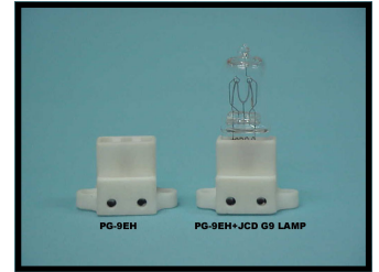
Avec oreilles 250V-200W Commande :PG-9EH