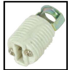
Support 1/8 IPS 120V Commande :00079-1582