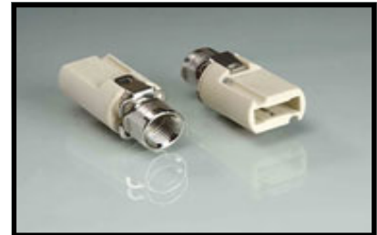
2 morceaux support 1/8 ips 250V-200W Commande :PG-9-HC