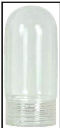
Vitre tubulaire avec filet Commande :00079-1591