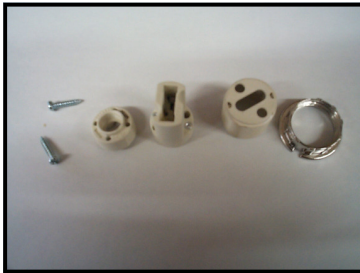
4 morceaux support 1/8 ips 250V-200W Commande :PG-9-03-D3