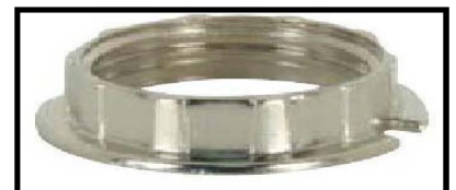
Anneau chrome pour vitre Commande :00079-1583