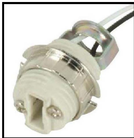
120 volts 21'' fils UL 10362 Commande :00079-1589 72'' fils UL 10362 Commande :00079-1590