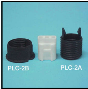
3 morceaux support 1/8 ips 250V-200W Commande :PG-9HB